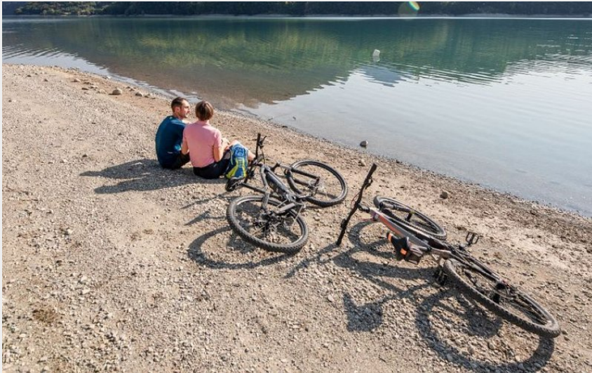
Pause au lac du Sautet