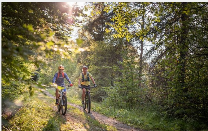
alentours du Lac de Roaffan (Parc national Ecrins - Thibaut Blais)