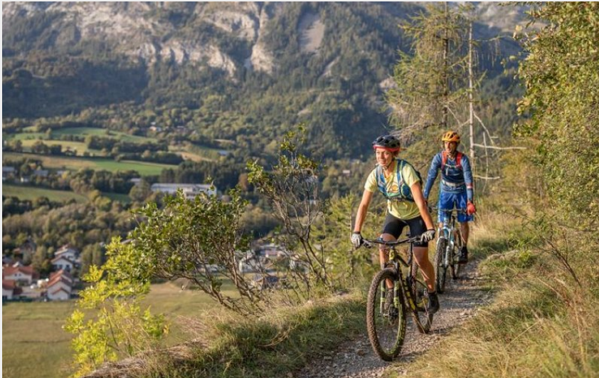
Descente depuis Saint Léger (Parc national Ecrins - Thibaut Blais)