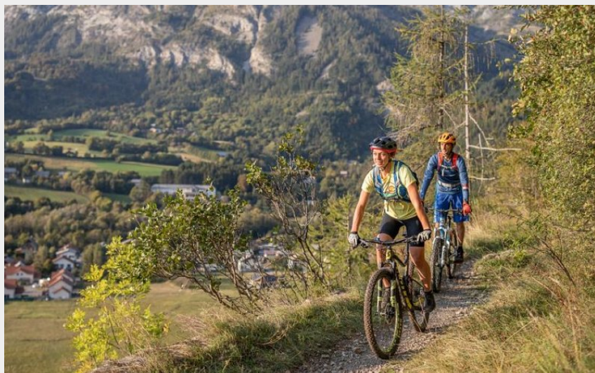
Descente depuis Saint Léger