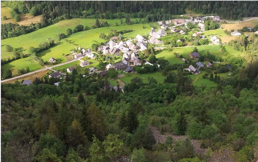
Hameau de la Chalp (Nicollet Bernard - PNE)