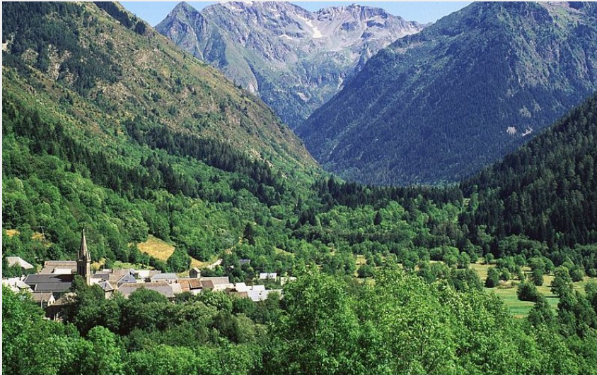
La Chapelle-en-Valjouffrey (Jean-Pierre Nicollet)