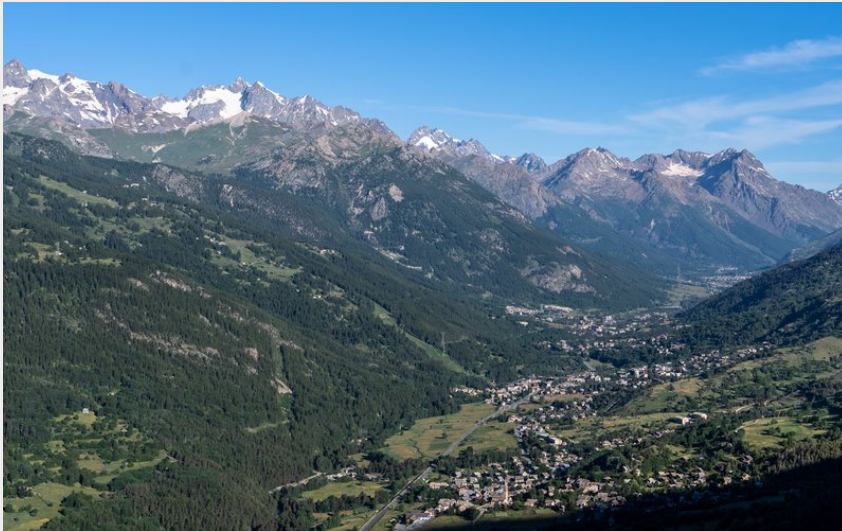
Vue sur la vallée de Serre Chevalier