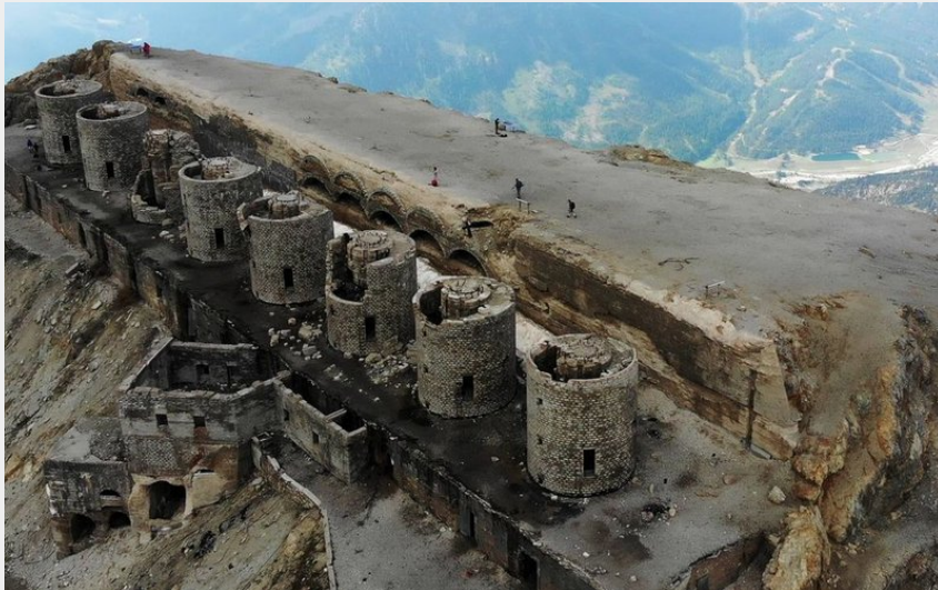
Le Fort du Chaberton