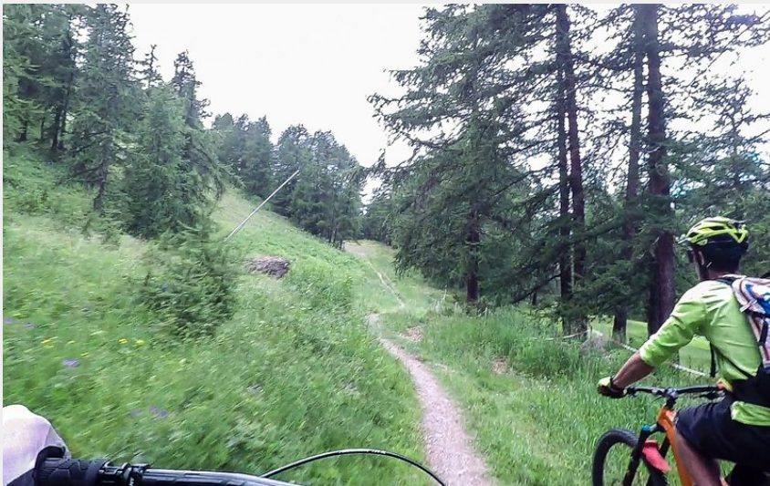
Bois de la Blanche (M. Buffet)