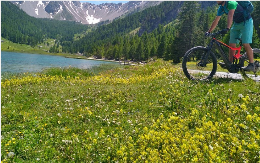
le lac de l'Orceyrette (M. Buffet)