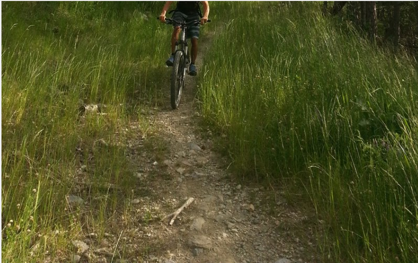
Vététiste en forêt (M. Buffet)