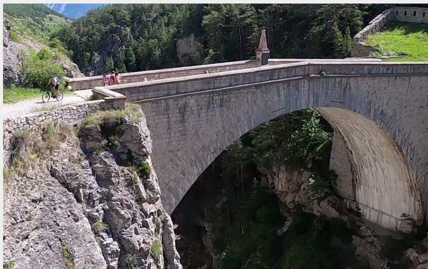
Le pont d'Asfeld (M. Buffet)