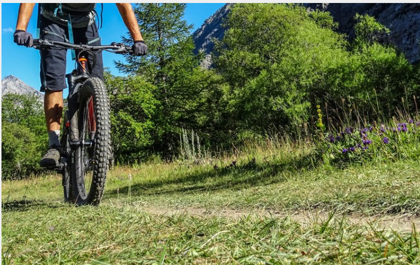
Vététiste dans la Vallée Étroite (M. Buffet)