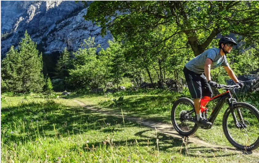
Paysage (Maxime Buffet)