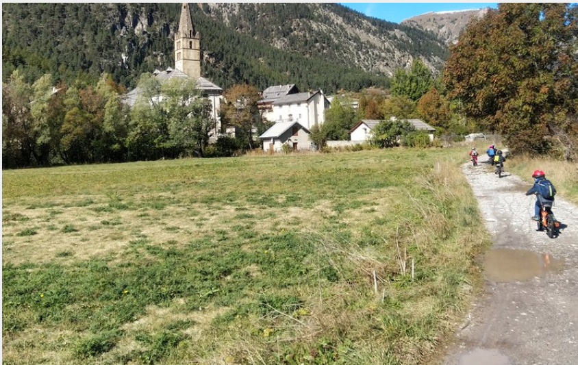
Découverte des villages de la vallée de la Clarée (M. Buffet)