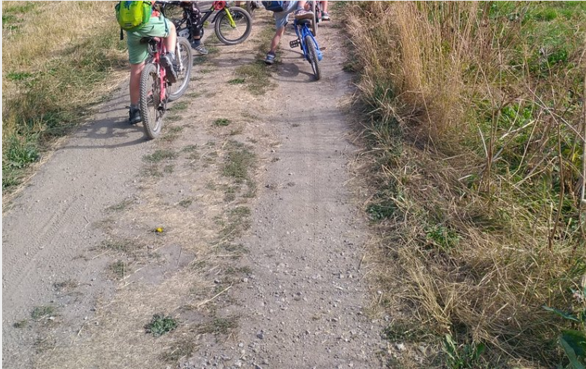
Remontée en fond de Vallée de la Guisane (M. Buffet)