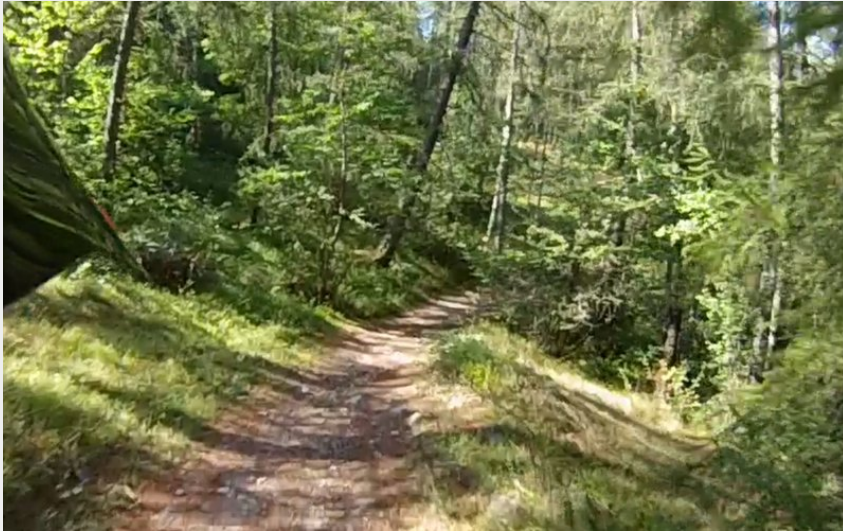
Sentier descendant le long de la Guisane (M. Buffet)