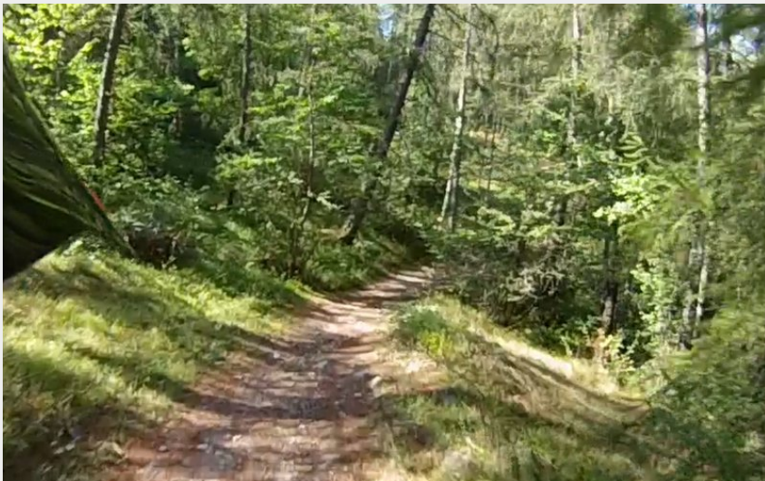
Sentier descendant le long de la Guisane (M. Buffet)