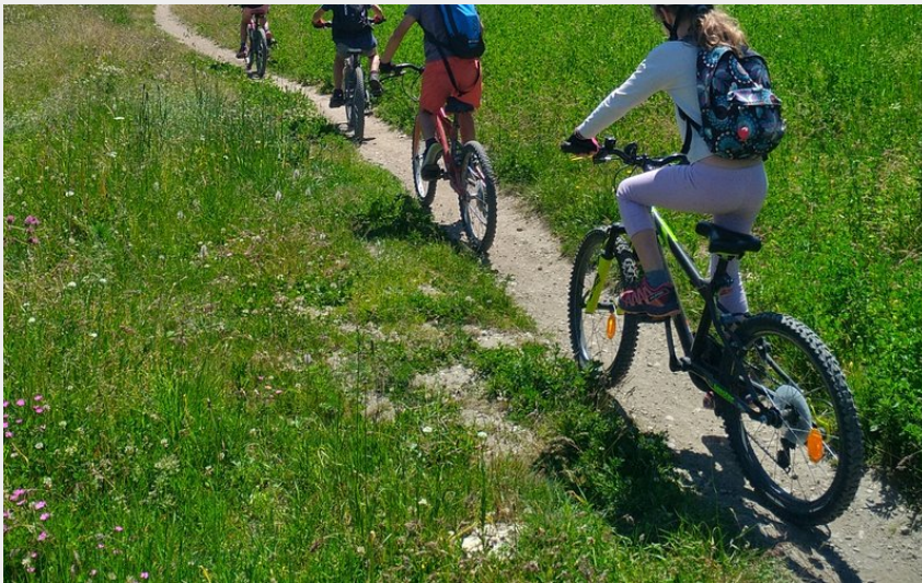
Balade familiale entre les prés (M. Buffet)