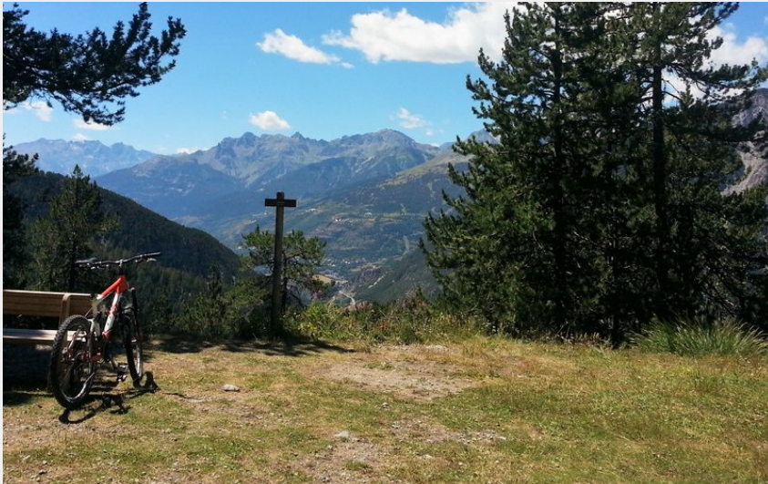
Point de vue sur la Clarée (M. Buffet)