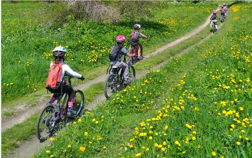
Balade à travers les champs de la Guisane (M. Buffet)