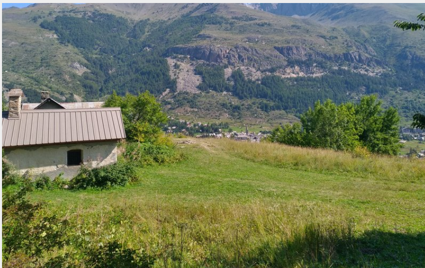
La Chapelle de Charvet perchée au dessus du Monétier-les-Bains (M. Buffet)