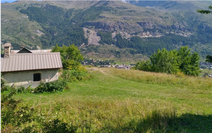
La Chapelle de Charvet perchée au dessus du Monétier-les-Bains (M. Buffet)