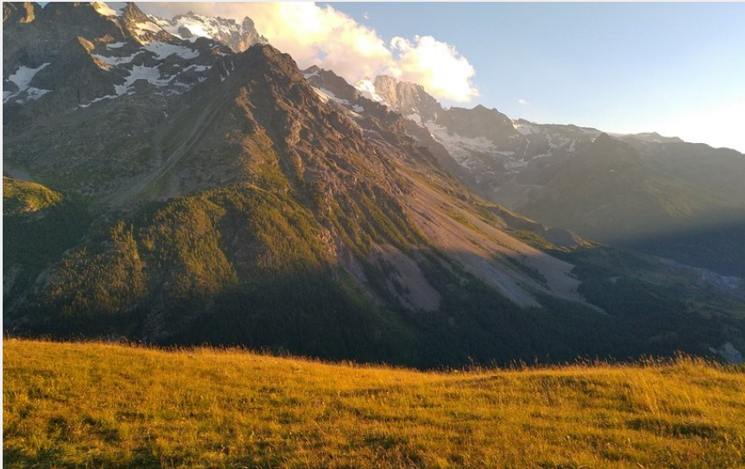
Coucher de soleil sur les sommets enneigés (M. Buffet)