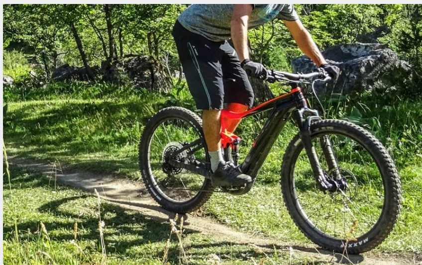
Ombre et soleil le long de la Romanche (M. Buffet)