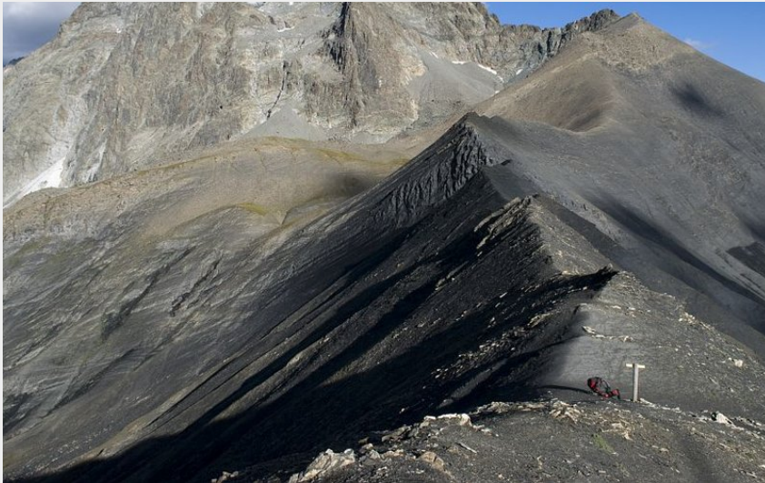
Col de Vallonpierre et Sirac