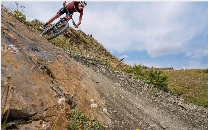
(Rogier Van Rijn)