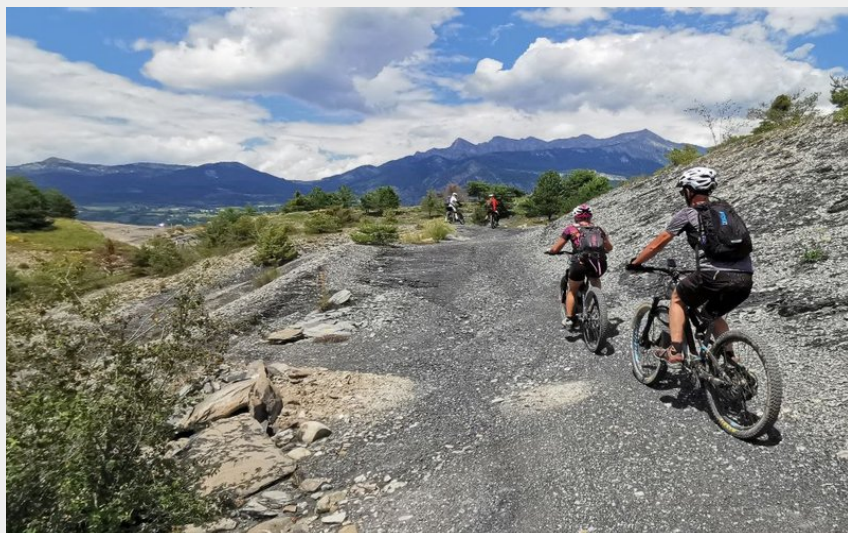
Dans les marnes (Parc national Ecrins - E-Pedal)