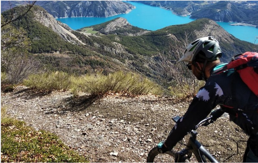
Vue sur le Sauze-du-Lac depuis les hauteurs de Rousset (Parc national des Ecrins - Emmanuel Danjou)