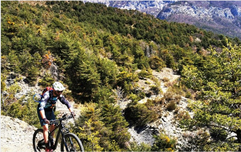
Vue atypique sous le Morgon (Parc national des Ecrins - Emmanuel Danjou)