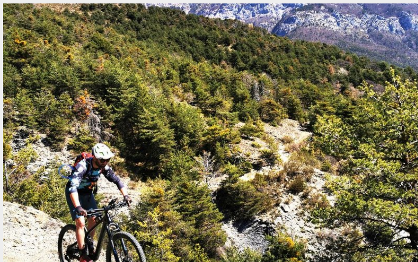
Vue atypique sous le Morgon