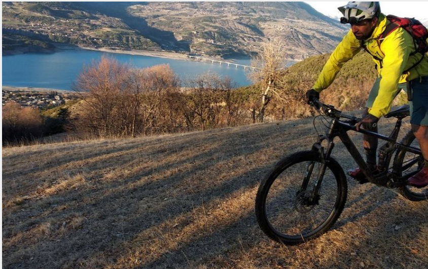
En surplomb du lac en automne