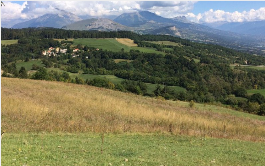
Vue sur le Chapeau de Napoléon