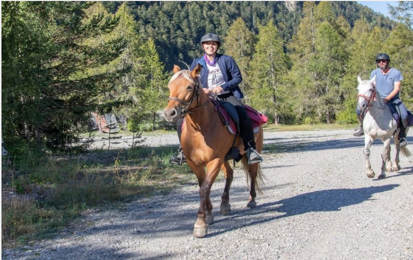
Au pas (Parc national Ecrins - Thibaut Blais)