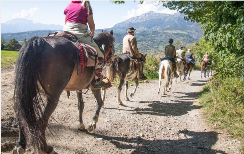
A St Léger Les Mélèzes