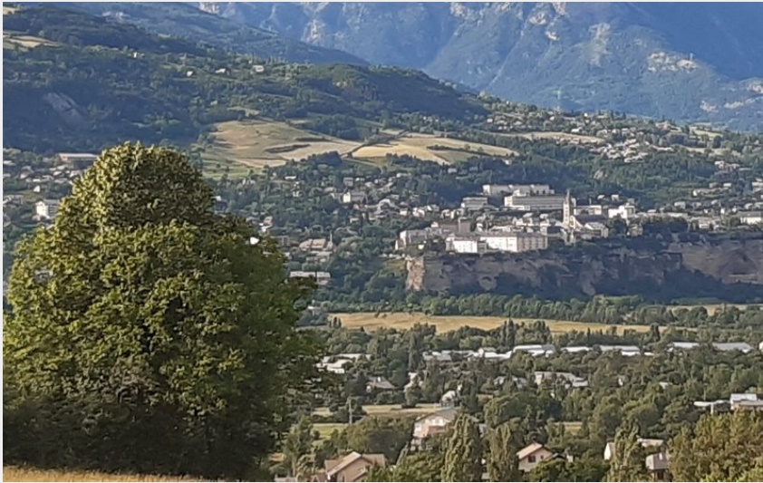
La ville haute d'Embrun (florimont.tilliere)