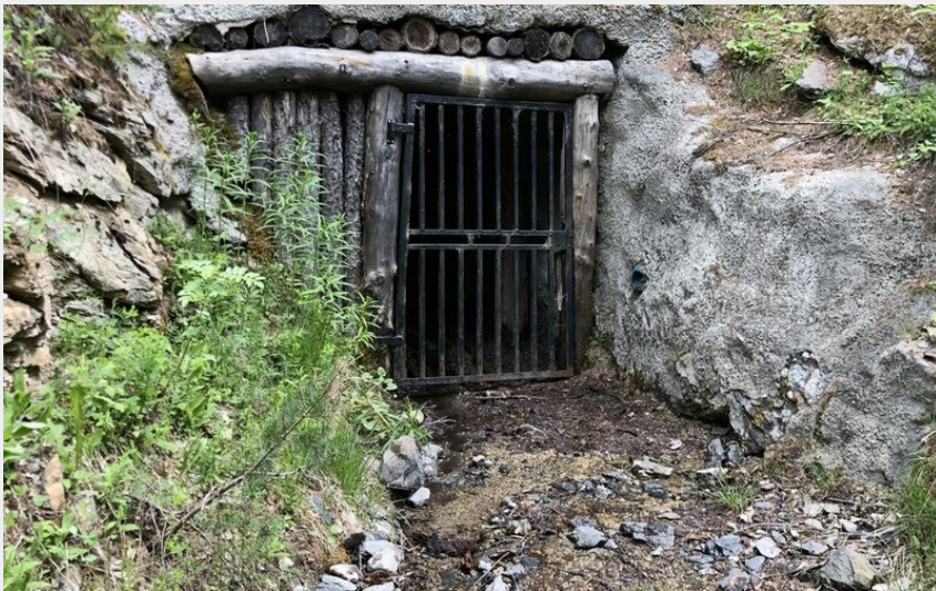
Entrée de la mine de la cabane à Villard-Saint-Pancrace