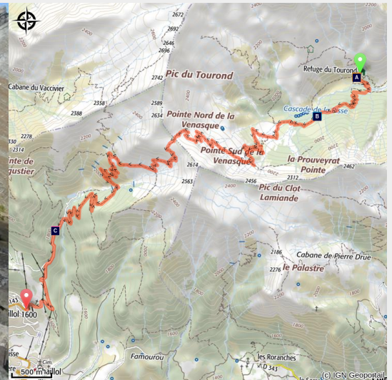
Pointe de la Venasque

Une étape tout en lacets qui associe passages entre les mélèzes et pentes montagneuses.