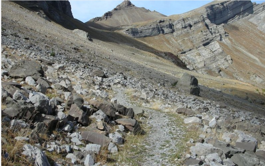
Pointe de la Venasque