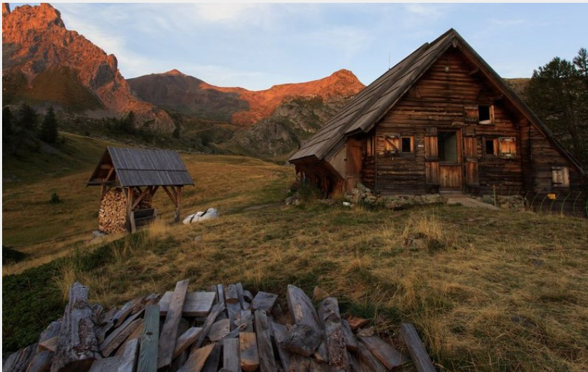
Refuge du Chardonnet