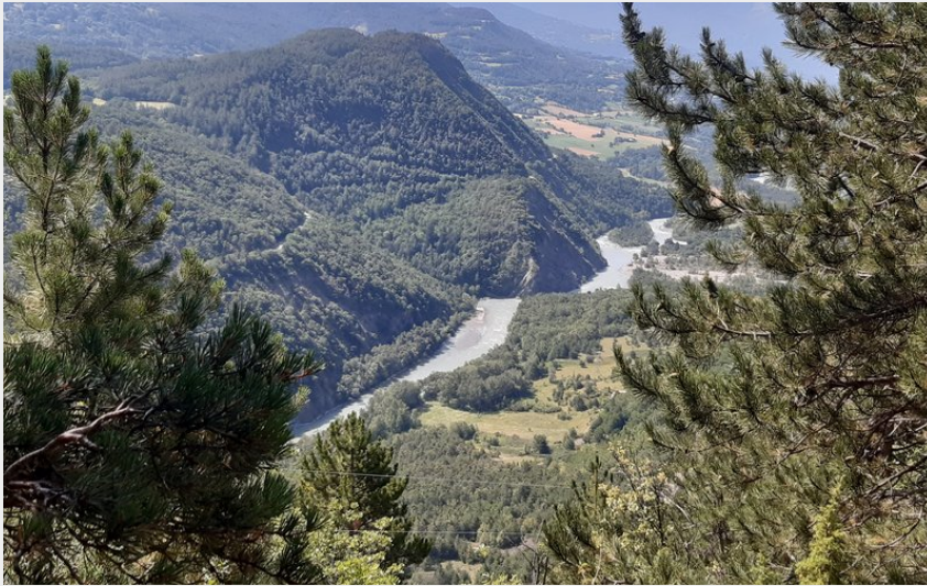
La vallée de la Durance (florimont.tilliere)