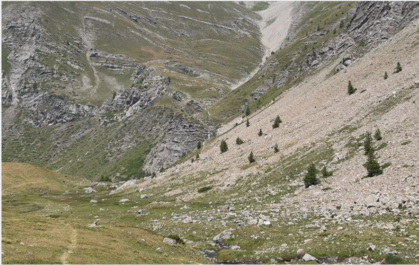
Le col de Reyssas (florimont.tilliere)