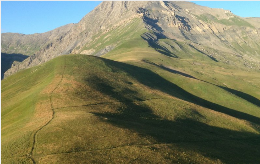
La crête de l'Aiguillon