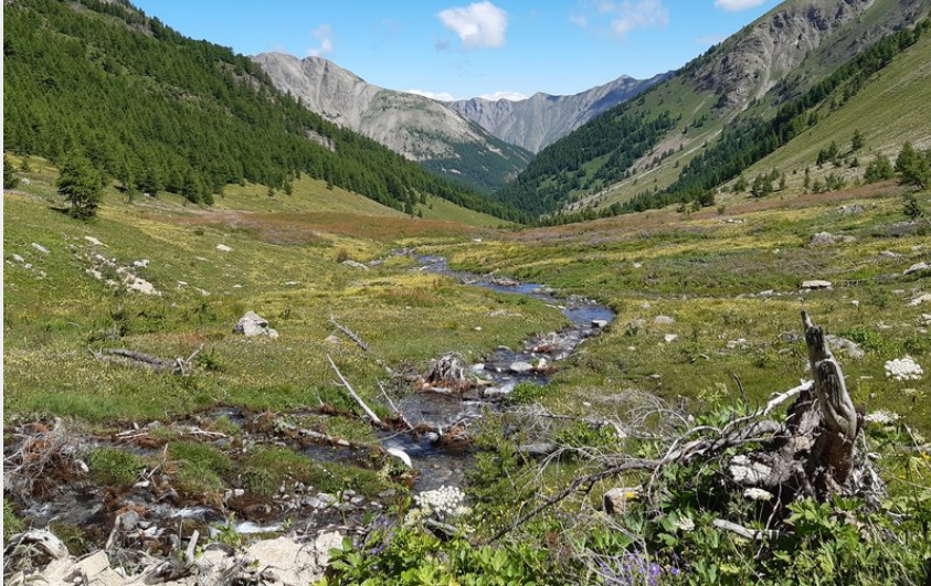
Les alpages sous le col (florimont.tilliere)