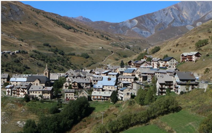
Hameau du Chazelet