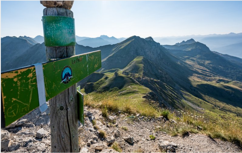
Sommet du Piolit (Rémi Morel)