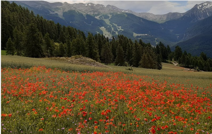
Champ de coquelicots (florimont.tilliere)