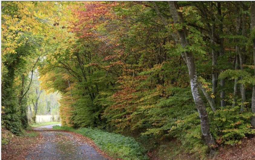
Bois de Saint-Laurent