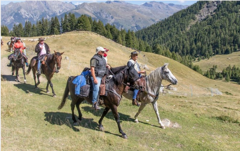
Alpage de Combeau