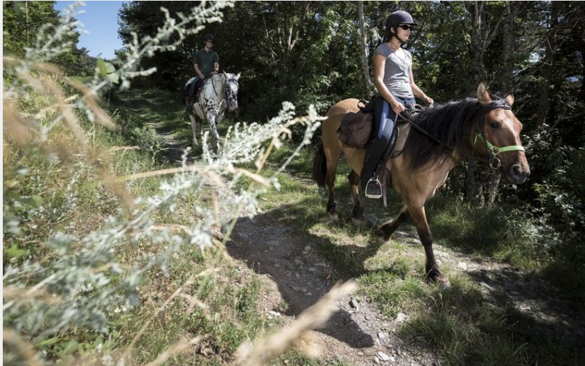
Randonneurs à cheval